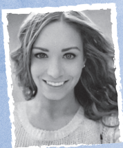
AVA 24 PARA SIEMPRE