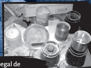
Laboratorio ilegal de pastillas de fentanilo