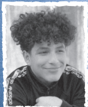
ISSAIAH 15 PARA SIEMPRE